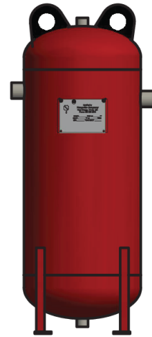
VR14-36 – VR18-60 MODELLERİ

Bu bilgi notunu diğer dillerde okumak için sitemizi ziyaret edin veya QR kodunu okutun.