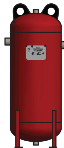
MODELOS VR14-36 - VR18-60

Para traducciones de esta hoja de datos, vaya a nuestro sitio web o escanee el código QR.